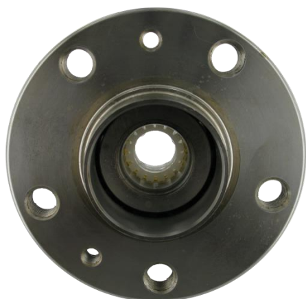
Łożysko z plastikową tulejką zabezpieczającą

SKF stosuje bezpieczne rozwiązania w zakresie pakowania produktów, aby uniknąć uszkodzenia łożyska w transporcie czy podczas montażu. Zestaw VKBA 1435 dostarczany jest wraz z plastikową tulejką, łączącą bieżnię wewnętrzną dopóki łożysko nie zostanie zamontowane w samochodzie.