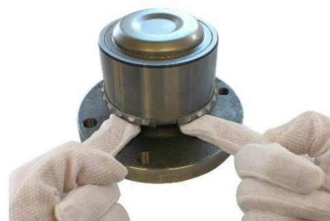
3. Wsuń pierścień na właściwą pozycję.