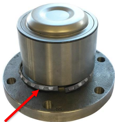
1. Zsunięty pierścień zabezpieczający.