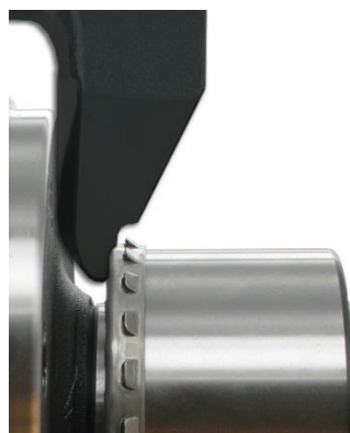
5. Stosuj narzędzie specjalistyczne SKF VKN 600 celem montażu piasty koła.

Kliknij tutaj, aby oglądać techniczne filmy SKF na Youtube!