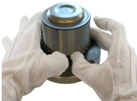
2. Delikatnie rozegnij pierścień.