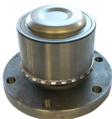
4. Pierścień jest w odpowiedniej pozycji.